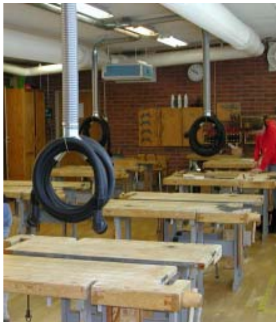
Bättre luft och trivsammare arbetsmiljö med CENTAB´s centralutsugsanläggningar med ventilationsfunktion.