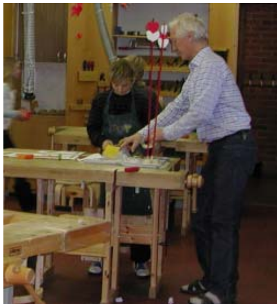
Bättre luft och arbetsmiljö med CENTAB centralutsug.