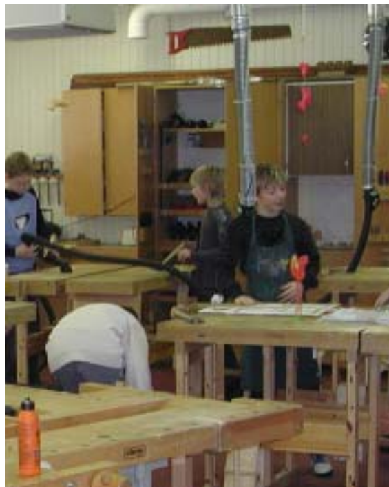
Bättre och trivsammare arbetsmiljö med CENTAB´s centralutsugsystem.